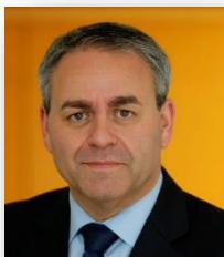
Xavier BERTRAND , Président de la région Hauts-de-France