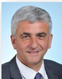
Hervé MORIN, Président de la région Normandie Président de Régions de France