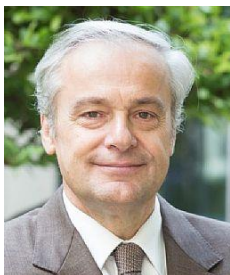
Rollon MOUCHEL-BLAISOT, Préfet, Directeur du programme national « Action cœur de ville »